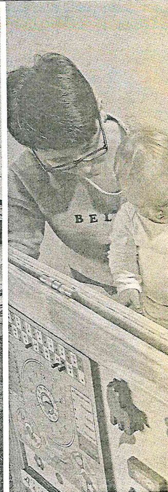
Свято-Троицкий собор в Колпино стал местом, где семьи особых детей встречаются с остальным миром