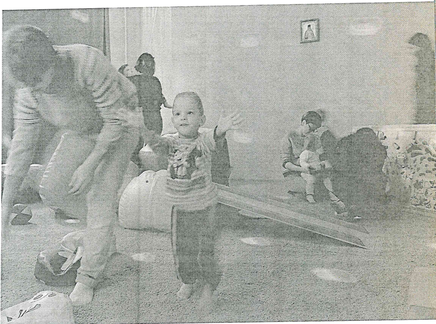
сенсорной комнаты в Колпино до этого не было даже в специализированных учреждениях