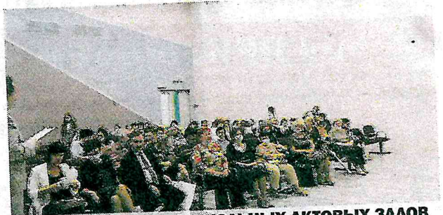
9 ШКОЛЬНЫХ АКТОВЫХ ЗАЛОВ ОТРЕМОНТИРОВАНЫ

Я всегда буду помогать тем людям, для которых нет чужих бед.