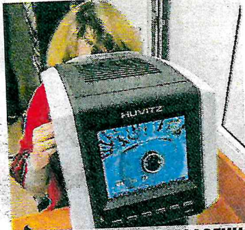
КАБИНЕТ ОФТАЛЬМОЛОГИИ ДЕТСКИЙ САД № 42

Я убеждена, что те, кто работает с детьми-инвалидами, – истинные гуманисты, их труд сродни подвигу. Я восхищаюсь работой специалистов Центра реабилитации инвалидов и детей-инвалидов «Поддержка» и всегда стремлюсь им помогать. Вместе нам удалось открыть пункт проката на улице Красной, 1. При моём содействии были закуплены ходунки, кресла-коляски, трости